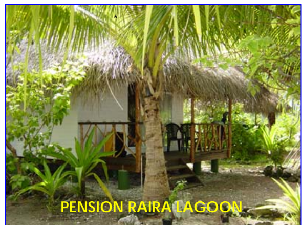
PENSION RAIRA LAGOON

** Consultar suplementos de vuelos según fecha De salida